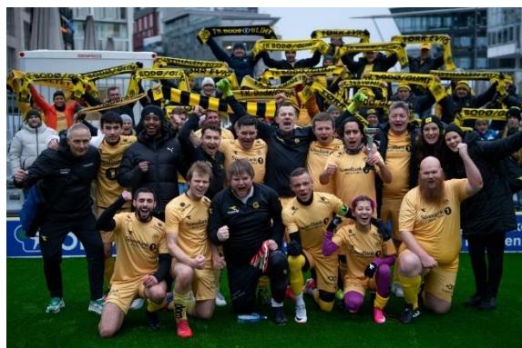
Glimt-jubel etter gatelagscupfinalen.

Gatelagscupfinalen var en nyvinning, som utvilsomt ble starten på en ny og morsom tradisjon.