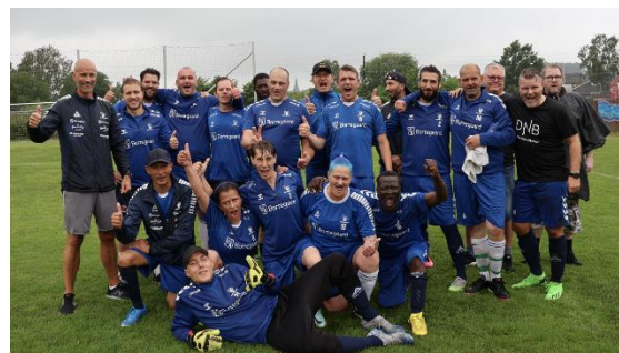
Sarpsborg 08s nyetablerte gatelag i det offisielle klubbutstyret.

Gatelagene bruker samme utstyr som både A-lag og andre lag i klubbene, noe som forsterker lag og spillere som en ekte del av byens/regionens fotballstolthet. Det å uniformere spillerne i likt utstyr, styrker fellesskapet. At gatelagene bruker det offisielle klubbutstyret er en viktig del av både inkludering og sosialisering – både i laget og som en reell og ekte del av klubben og den stolte identitetsbygger den er.