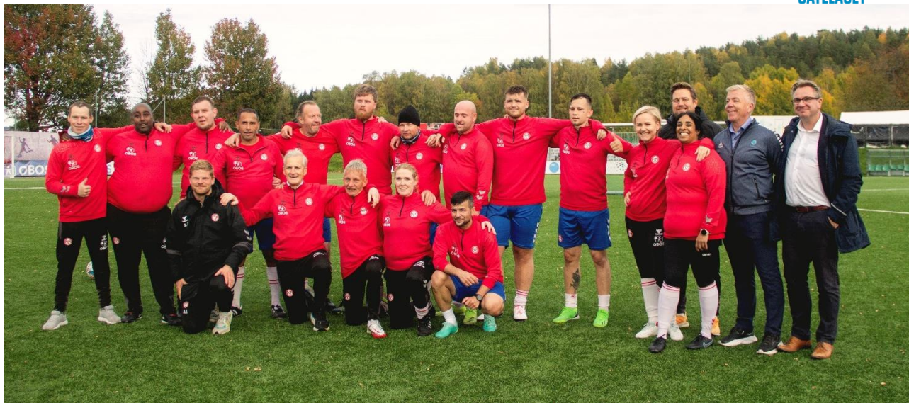
Fra regjeringsbesøket på KFUMs trening.