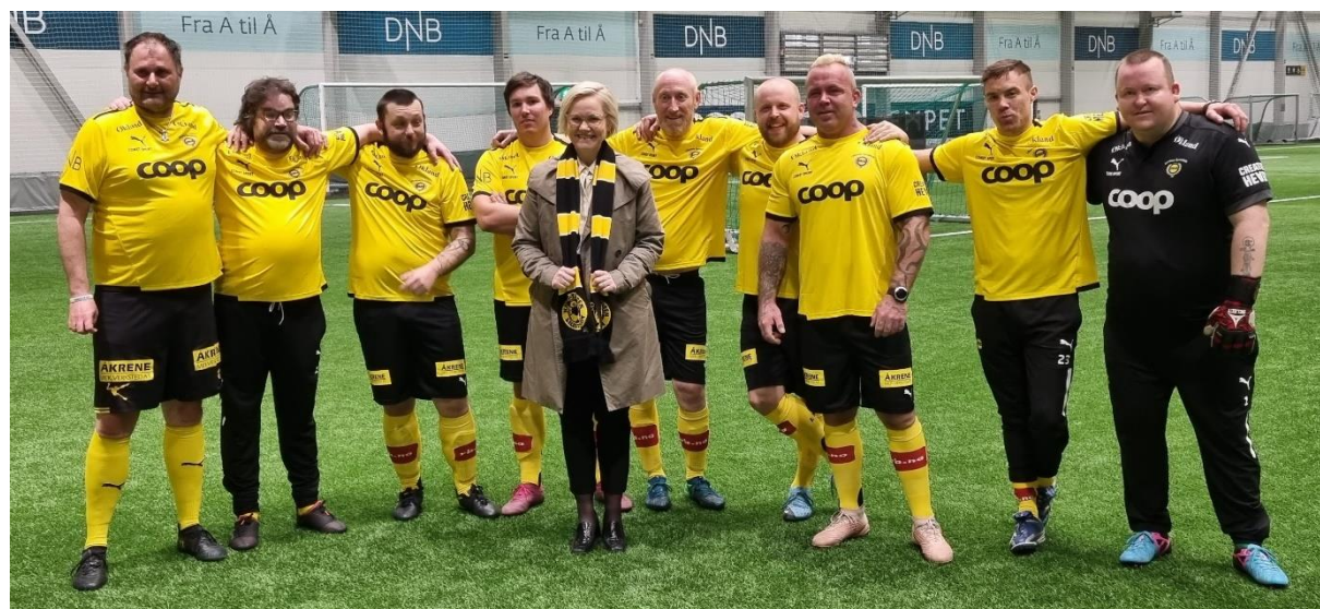
Helseminister Ingvild Kjerkol besøkte Lillestrøms gatelag i mars.

Det vil i 2023 være behov for et budsjett på over 25 mill. kr pga utvidelser av vellykkede prosjekter, generell prisvekst i Norge – i tillegg til midler for etableringer av flere gatelag i Fotballstiftelsen, noe som er ønsket både av lokale myndigheter / rustjenester, av robuste klubber og av storsamfunnet.