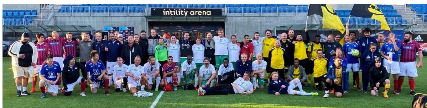
Fem lag - ett felles lagbilde, tatt under en turnering på Intility Arena – der Fram, HamKam, Lillestrøm, Strømsgodset og vertsklubben Vålerenga deltok #samholdpåekte

«Alle som jobber i gatelagsbransjen er helter som redder liv. Tusen takk.»