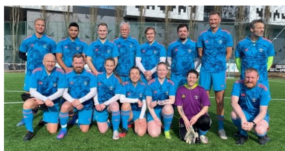
Kongsvingers nyansatte gatelagsansvarlige (t.v.). Rosenberg opplevde stor vekst i sitt første hele driftsår (t.h.)