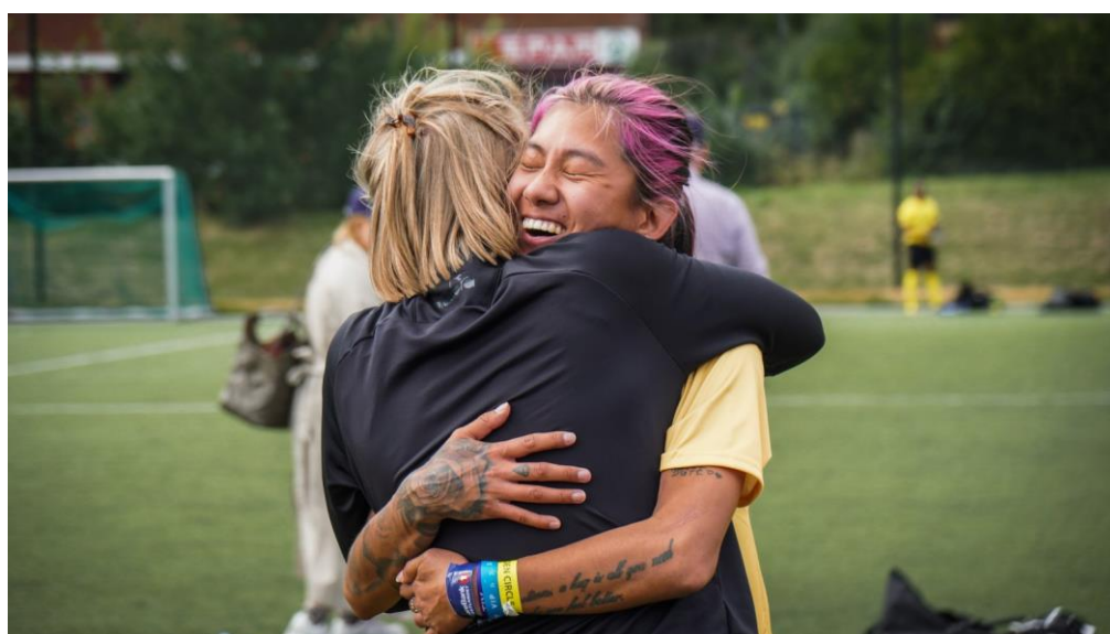
Ruskonsulenten i Bodø kommune og spiller på Bodø/Glimt jubler sammen under Nasjonal turnering på Nadderud i august.

Dette, og våre øvrige prosjekter og aktiviteter, omtales videre i denne beretning.