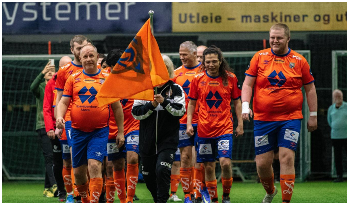
Fra innmarsjen da Aalesund FK var vertskap for regional turnering i Midt-Norge.